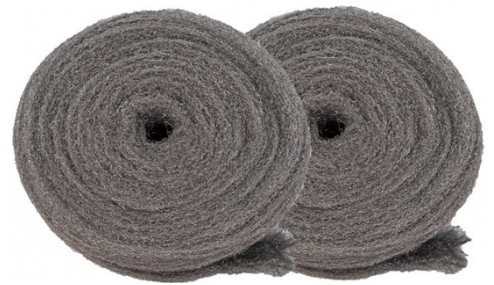
LANA DE ACERO Nº1 2,5 KG C2