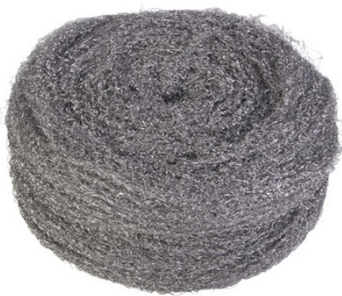
LANA DE ACERO Nº2 2,5 KG C2