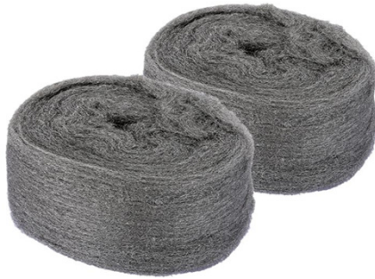
LANA DE ACERO Nº0 2,5 KG C2