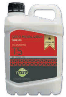
CERA METALIZADA T5