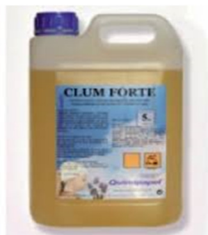
MP 2013 CLUM FORTE C4 DESENGRASANTE FREASUELOS CON MAQUINA