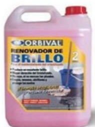
RENOVADOR DE BRILLO 2 LT