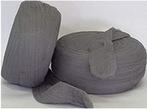
LANA DE ACERO 0000 2,5 KG C2