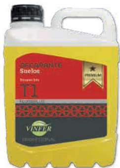
DECAPANTE SUELOS T1